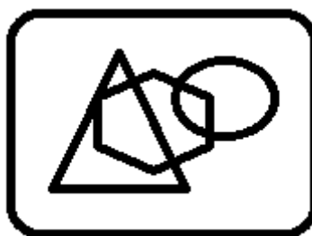
Рис. 1. Название рисунка

Таблицы, рисунки, схемы, графики должны быть пронумерованы и озаглавлены. Все рисунки должны быть четкими – 300 dpi в формате tif или jpg. Например: